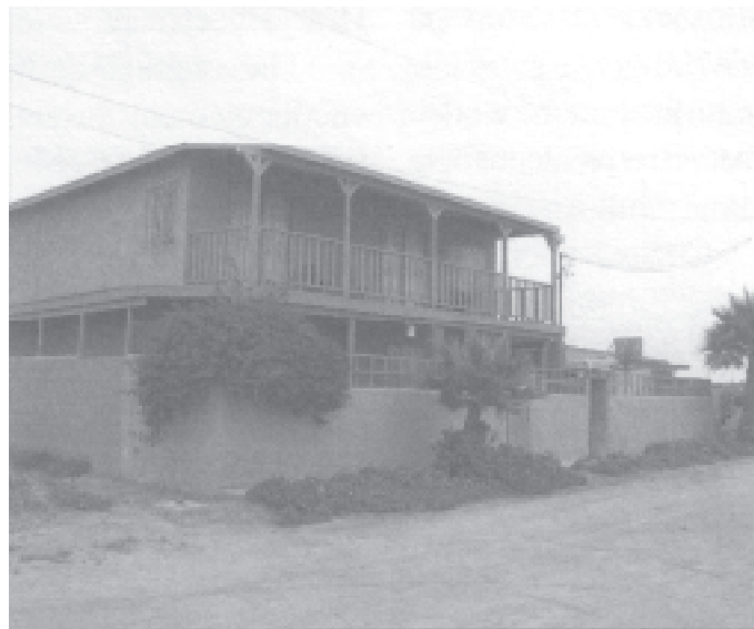
Миссионерский дом в Мексике, Бая Калифорнии

Где недостаёт суда, там следуют компромиссы, грех и заблуждение