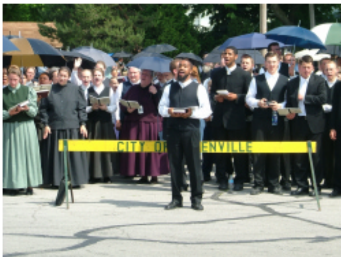
Собрание на улицах города Гринвилл, Огайо