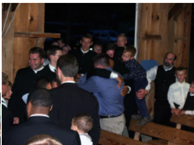
Пропавшая овечка нашлась.