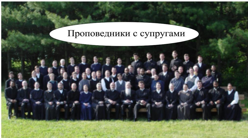
Проповедники с супругами