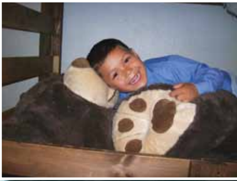
Нижняя Калифорния, Мексика