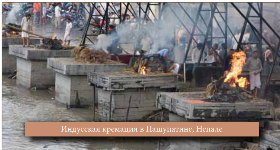
Индусская кремация в Пашупатине, Непале